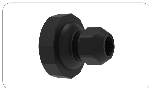
180° Kabelausgang für Durchmesser: 180° cable outlet for diameter:

7,7 - 9,3mm 9,7 - 11,3mm 10,7 - 12,3mm 12,0 - 14,4mm