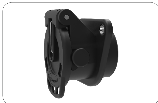
JAEGER BASIC Park-Steckdose JAEGER BASIC Parking socket