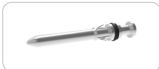
Kontaktstift für Leitungsquerschnitt: Contact pin for wire cross-section:

0,75mm 2 1,0mm 2 1,5mm 2 4,0mm 2 6,0mm 2