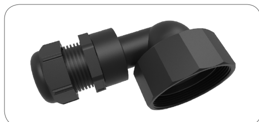
90° Kabelausgang für Durchmesser: 90° cable outlet for diameter: